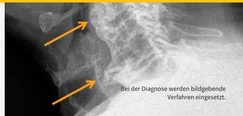
Bei der Diagnose werden bildgebende Verfahren eingesetzt.